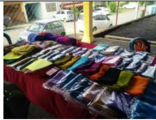
PROGRAM DASHBOARD BERSAMA USAHAWAN AIM