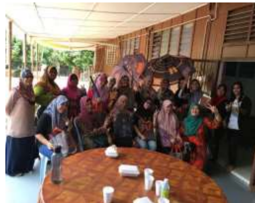
KARNIVAL BSN, HARI KANTIN DAN PERKHEMAHAN PERINGKAT SEKOLAH