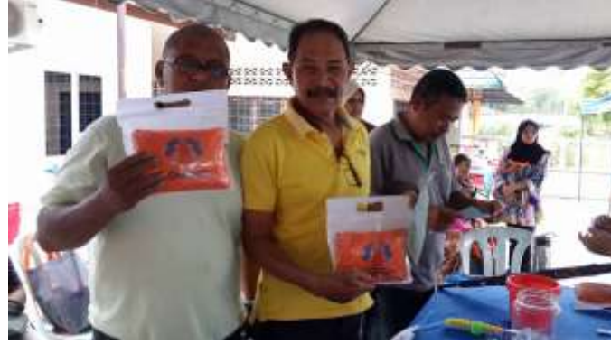
KUIZ KDB & DASHBOARD