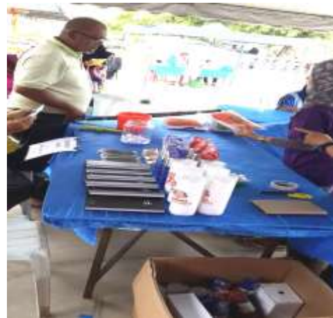
PENDAFTARAN PENGUNJUNG, PENERANGAN DASHBOARD KOMUNITI