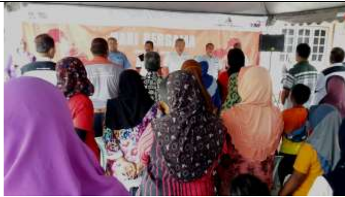
MAJLIS PERASMIAN & PENUTUP PROGRAM