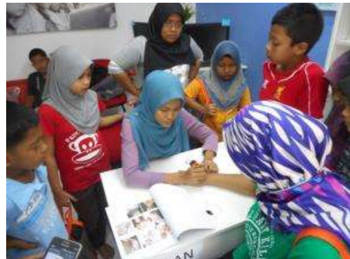
PEMERIKSAAN KESIHATAN OLEH KOSPEN & UKIRAN INAI USAHAWAN TEMPATAN